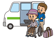
バリアフリー旅行