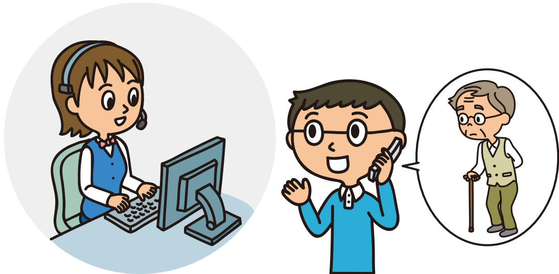
介護に関する専門相談員がサポート!