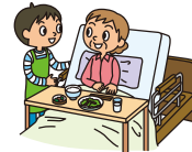
有料老人ホーム・ 高齢者住宅